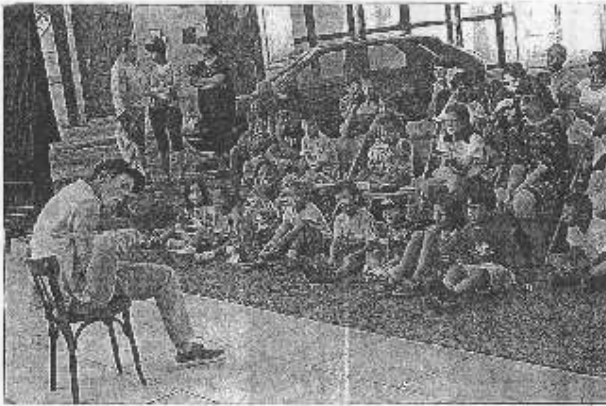
Pataruc entretient des rapports privilégiés avec ses pieds

Le progrès - La Tribune du 22/08/2008 Le Puy en Velay - 45