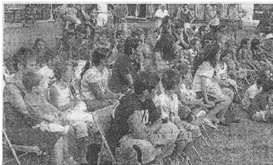
Les enfants (et leurs parents) ont grand ouvert les yeux et les oreilles.

Le comédien est bluffant de naturel et de spontanéité. C'est ce qui lui a sans doute permis de conquérir l'assistance. Les parties chantées du spectacle scellent cette belle complicité, les enfants - et leurs mamans - reprenant en cœur les paroles de Pataruc. Une belle réussite.