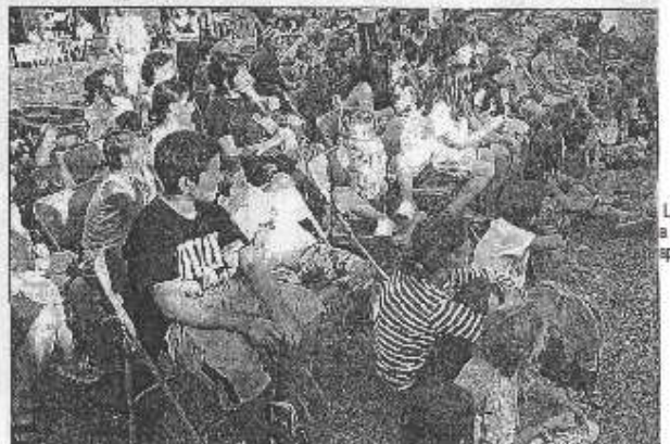
Le public a apprécié le spectacle.