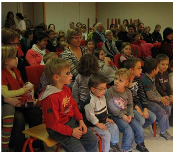
Les enfants ont participé au spectacle.

Samedi après-midi, au centre culturel de Montrevel-en-Bresse, la médiathèque de la communauté de communes a organisé un spectacle pour enfants mais aussi pour leur famille. Dans une salle bondée, Pataruc, clown conteur et chanteur a annoncé la visite de la fée du bizarre. Cette étrange fée a besoin d'air pour respirer. Pataruc doit chanter pour elle, trouver le bon air et la chanson qui lui convient. Plutôt obstiné, le clown s'en va pour trouver l'air féérique, sa route l'emporte dans un endroit où il ne pensait jamais aller. Entre contes, chansons et poésies, Pataruc s'initie alors au monde des fées et du bizarre. Les enfants ont participé aux nombreuses scènes comiques avec beaucoup de joie.