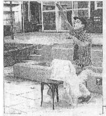
Pataruc dans l'une de ses élucubrations.

La Grosse Drin-drin et sa bande sont encore de passage au Puy. L'occasion de connaître, à la fois la fin de l'histoire et admirer le jeu de ce formidable acteur qui peut se targuer d'entretenir une parfaite complicité avec les enfants.