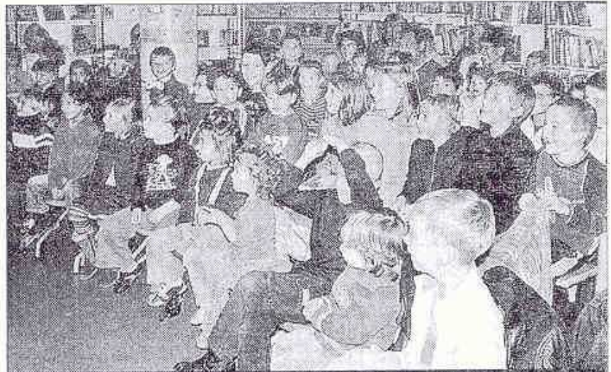
ADMIRATION. La joie, le rire, le bonheur pour tous les présents.

Il joue, il taquine les étoiles et, tout seul, réinvente le rêve, l'imaginaire