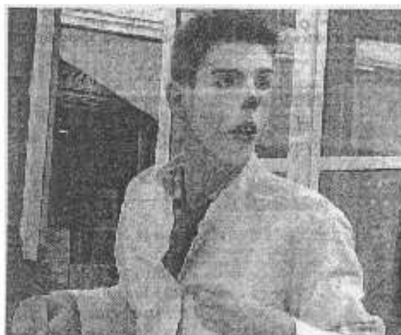
Les mimiques auachanes de ce clown un peu irrisé ont conquis les spectateurs.