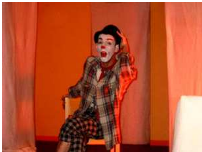
Le Clown Pataruc, un personnage inoubliable